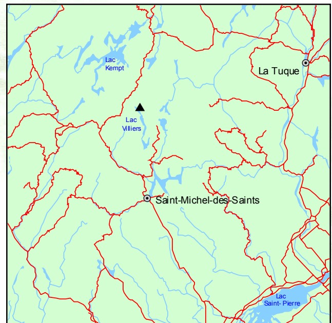
▲ Forêt ancienne du Lac-Villiers

La forêt occupe plus précisément une longue colline étroite qui sépare le lac Villiers en deux bassins. Cette position géographique, difficilement accessible pour l'exploitation forestière, offre une bonne protection contre les grands feux. Le relief peu accentué est formé de petites collines aux versants en pente faible où les conditions du sol sont mésiques. Le sommet des collines est occupé par l'érablière à bouleau jaune alors que les versants, dont le sol est généralement plus frais, sont plutôt colonisés par la bétulaie jaune à sapin et à érable à sucre. Le couvert forestier des érablières, qui atteint environ 25 m de hauteur, est caractérisé par la présence dispersée de trouées, d'environ 100 m 2 ,