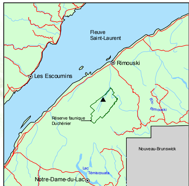
▲ Forêt ancienne du Lac-des-Baies

Le sous-étage de la forêt renferme quelques essences feuillues; celles-ci ont commencé à s'établir grâce à l'ouverture créée dans le couvert par la disparition du sapin. Le parterre forestier compte plusieurs espèces typiques des milieux secs, notamment Vaccinium angustifolium , Chimaphila umbellata , Epigaea repens et Gaultheria procumbens .