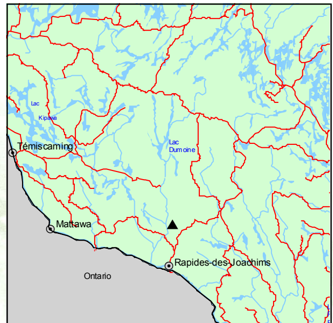
▲ Forêt ancienne de la Rivière-Poussière

La forêt occupe un versant, dont les pentes varient de faibles à douces, qui donne sur la rivière Poussière, à environ 2 km de la rivière Dumoine. La strate dominante de la forêt se compose presque uniquement de pins blancs, qui atteignent une hauteur de 35 m au bas du versant. Le diamètre des arbres dominants, en moyenne de 55 cm, est particulièrement homogène. Le sous-étage est formé de pins blancs accompagnés de sapins baumiers.