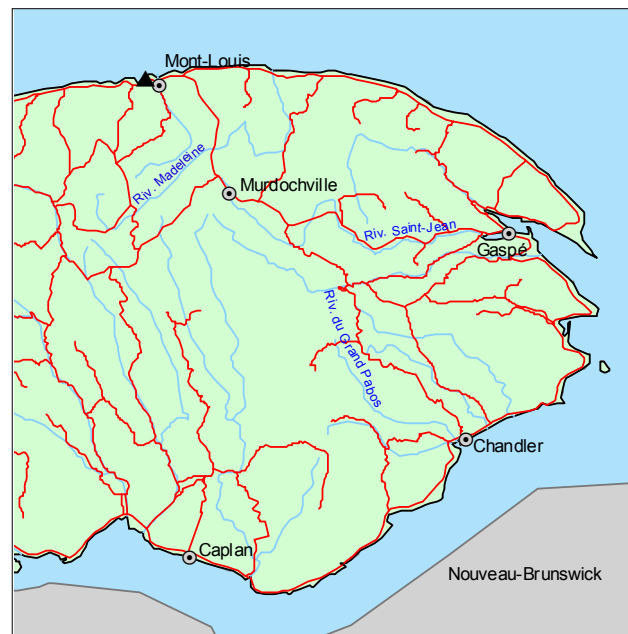
▲ Forêt refuge du Ruisseau-du-Petit-Moulin

Outre la dryoptère fougère-mâle, la forêt refuge est colonisée par une végétation herbacée comprenant des espèces d'habitat mi-ombragé comme Sanicula marilandica , Ageratina altissima , Dryopteris carthusiana et Cystopteris bulbifera .