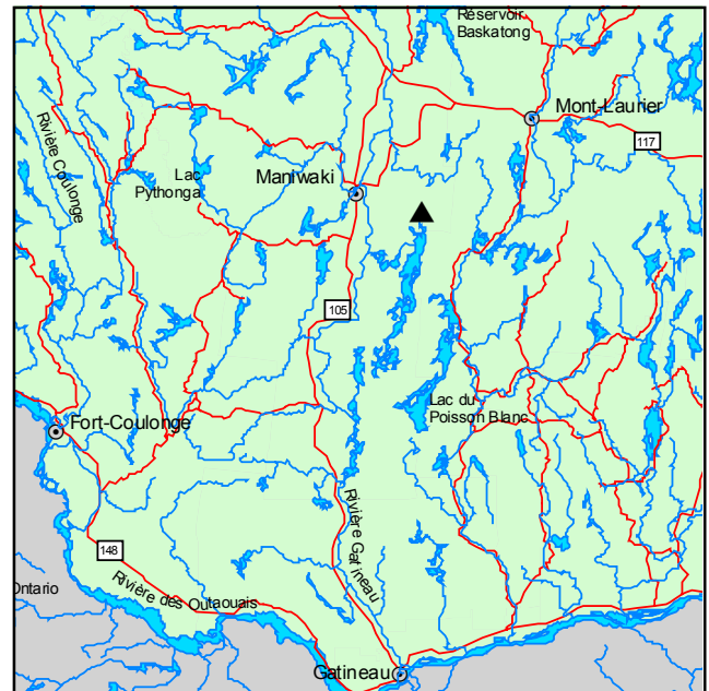
▲ Forêt refuge de la Baie-Noire

Outre ces deux espèces d'orchidées, la vieille cédrière ouverte de la forêt refuge renferme du thuya accompagné de sapins et de mélèzes. Les arbustes qui y sont les plus abondants sont Rhododendron groenlandicum , Lonicera canadensis , Cornus sericea et Acer spicatum . Les principales plantes herbacées sont Coptis trifolia , Clintonia borealis , Maianthemum canadense , Iris versicolor , Galium triflorum , Gaultheria hispidula , Mitella nuda , Moneses uniflora , Equisetum scirpoides , Carex trisperma , Carex leptalea et Carex vaginata . On y note aussi la présence d'autres orchidées, dont Cyripedium parviflorum , Platanthera dilatata , Platanthera obtusata , Platanthera huronensis , Platanthera orbiculata et Goodyera repens , et de quelques fougères, notamment Dryopteris carthusiana , Gymnocarpium robertianum et Dryopteris cristata . Composent la strate muscinale, Hylocomium splendens , Bazzania trilobata , Dicranum polysetum et Dicranum scoparium .