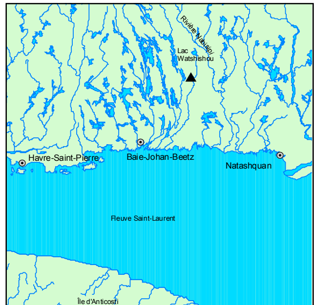
▲ Forêt ancienne du Lac-Auger

Les plantes et les arbustes du sous-bois sont peu diversifiés. On note surtout des mousses hypnacées et des plantes latifoliées communes en zone boréale comme Cornus canadensis , Clintonia borealis et Gaultheria hispidula .