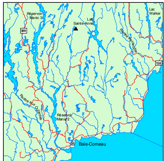
▲ Forêt ancienne du Lac-Leblanc

Les plantes et les arbustes du sous-bois sont peu diversifiés. On note surtout des mousses hypnacées et des plantes latifoliées communes en zone boréale comme Cornus canadensis et Linnaea borealis . Sorbus americana et Amelanchier sp. occupent la strate arbustive, mais ne représentent qu'une faible proportion du couvert végétal.