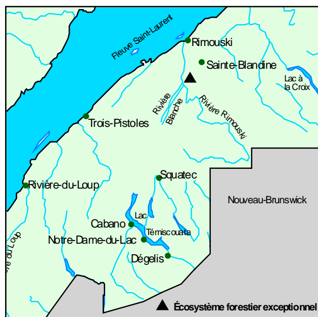
▲ Forêt refuge du Grand-Lac-Macpès

Outre du thuya occidental et de l'épinette noire, la strate arborescente de la forêt refuge renferme du mélèze laricin. Composent la strate arbustive Myrica gale , Rhamnus alnifolia , Alnus incana et Rhododendron groenlandicum . La strate herbacée comporte Maianthemum trifolium , Mitella nuda , Carex magellanica , Carex gynocrates et Carex flava . Sphagnum russowii , Rhytidiadelphus triquetrus , Aulacomnium palustre , Hylocomium splendens et Dicranum polysetum forment la strate muscinale.