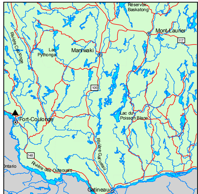
▲ Forêt refuge du Mont-de-Davidson

Outre l'hélianthe à feuilles étalées, cette chênaie rouge à pin blanc comporte plusieurs arbustes : Juniperus communis , Rhus typhina , Shepherdia canadensis , Diervilla lonicera , Vaccinium angustifolium , Comptonia peregrina et Arctostaphylos uva-ursi . La strate herbacée comprend Aralia nudicaulis , Polygonatum pubescens , Silene antirrhina , Apocynum androsaemifolium , Maianthemum racemosum et Artemisia campestris . Quelques fougères y sont aussi présentes, dont Pteridium aquilinum , Dryopteris marginalis et Woodsia ilvensis . Danthonia spicata et Deschampsia flexuosa sont les graminées les plus abondantes de cet écosystème.