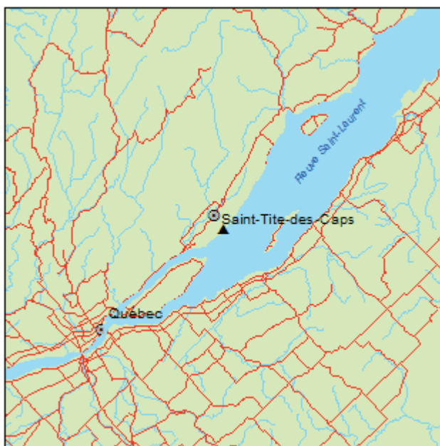
▲ Forêt ancienne du Cap-Brûlé

La forêt ancienne du Cap-Brûlé recouvre le roc des contreforts laurentiens et des dépôts d'éboulis rocheux parsemés de poches de till, où le drainage est très rapide. Elle est constituée tantôt de pins rouges tantôt de pins blancs accompagnés par l'épinette rouge. La régénération est nettement dominée par l'épinette rouge et complétée par l'épinette noire et le sapin baumier. La strate arbustive est principalement formée de la régénération des essences conifériennes, mais aussi de Juniperus communis . Cette espèce est peu fréquente dans les forêts fermées du Québec, mais, dans la partie sud de la province, elle préfère les abords du fleuve Saint-Laurent.