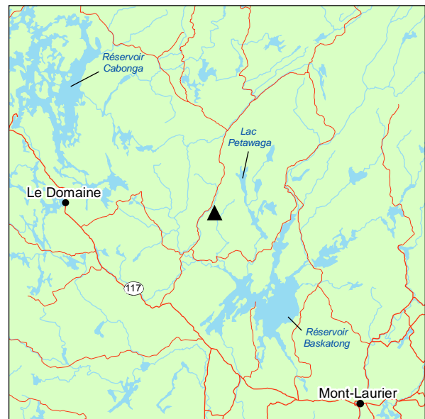
▲ Forêt ancienne du Lac-Corney

L'érablière à bouleau jaune repose sur un till et croît sur des flancs de collines généralement exposées à l'est. L'érable à sucre domine dans le couvert arborescent et y est accompagné du bouleau jaune. En sous-étage, l'épinette blanche et le sapin baumier viennent s'ajouter. La strate arbustive contient, outre la régénération naturelle des espèces arborescentes, la présence marquée de Viburnum lantanoïdes ainsi qu' Acer pensylvanicum , Corylus cornuta et Lonicera canadensis . La strate herbacée n'est pas très variée, mais on remarque tout de même Clintonia borealis , Huperzia lucidula , Erythronium americanum et Trientalis borealis .