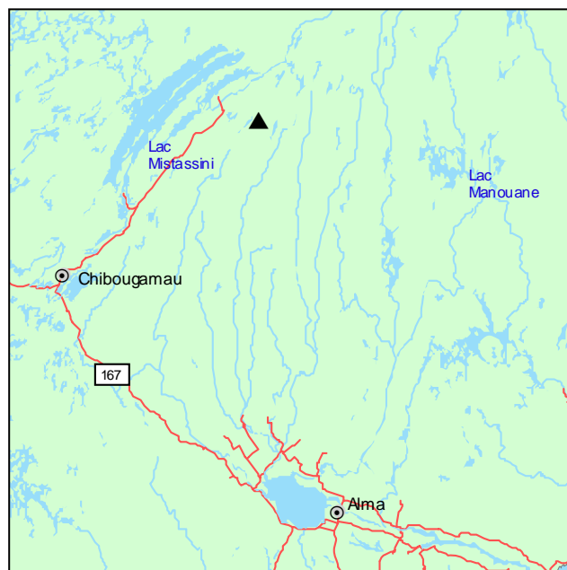
▲ Forêt ancienne de l'Esker-du-Lac-Cosnier

La strate arborescente supérieure de la forêt est essentiellement composée d'épinettes blanches et d'épinettes noires. Elle comprend également du sapin baumier, mais surtout en sous-étage. La strate arbustive est occupée par la régénération de ces mêmes espèces et par des arbustes comme Ledum groenlandicum et Vaccinium angustifolium . La couverture muscinale est quasi complète et largement dominée par des sphaignes et des mousses hypnacées, telles que Pleurozium schreberi et Hylocomium splendens .