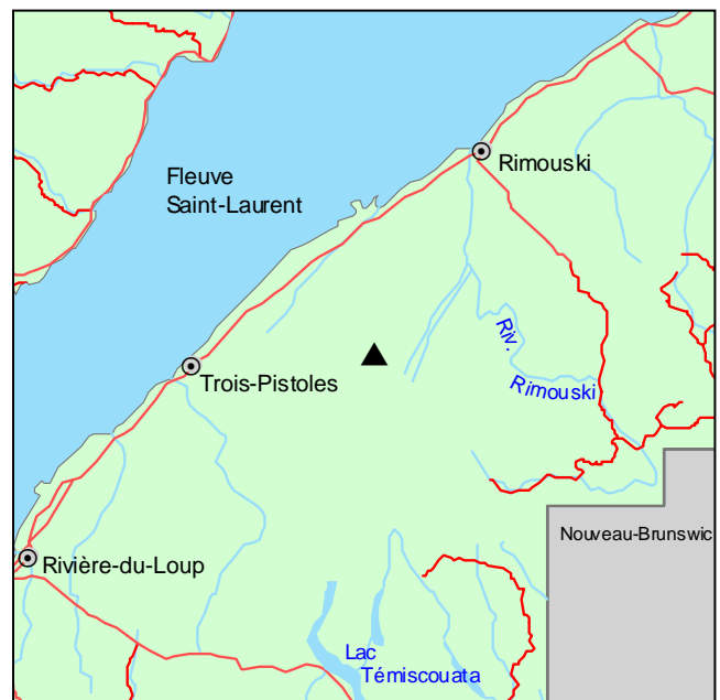
▲ Forêt ancienne de la Rivière-Cossette

Le couvert forestier de la forêt est largement dominé par l'érable à sucre, auquel se joignent le sapin baumier, le bouleau jaune et quelques épinettes blanches. La régénération en sous-étage est aussi très largement occupée par l'érable à sucre. On y trouve également l'érable de Pennsylvanie, le bouleau jaune et le sapin baumier. Le parterre forestier marque une certaine transition vers les forêts mélangées des collines appalachiennes. On y observe notamment plusieurs espèces acidophiles typiques des sapinières, par exemple, Oxalis montana , Huperzia lucidula et Maianthemum canadense .