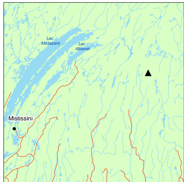
▲ Forêt ancienne du Lac-de-l'Hypne-Dorée

L'étage supérieur de la forêt est peu dense et presque exclusivement composé d'épinettes noires. Il en est de même du sous-étage et de la régénération. La faible densité du couvert va de pair avec l'implantation des éricacées dans la strate arbustive, qui est largement dominée par Ledum groenlandicum accompagné parfois de Vaccinium myrtilloides . La strate herbacée est presque absente, mais Pleurozium schreberi (l'hypne dorée) tapisse littéralement le sol.