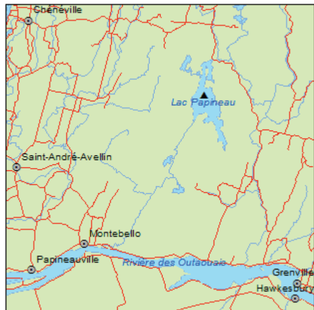
▲ Forêt ancienne des Îles-de-l'Indien-et-des-Cyprès

Des concentrations de pruches apparaissent à plusieurs endroits à travers l'érablière, là où les conditions lui sont favorables, soient généralement des sols pierreux, assez minces et au drainage rapide. Les prucheraies à érable à sucre forment des peuplements assez denses et ont une structure inéquienne. En plus de ces deux essences dominantes, on y trouve du bouleau jaune, du hêtre à grandes feuilles et du thuya occidental. Dans le sous-étage, l'érable de Pennsylvanie domine la strate arbustive et le hêtre à grandes feuilles abonde en régénération. Le sous-bois est surtout peuplé par Aralia nudicaulis et Dryopteris spinulosa . Epipactis helleborine et quelques espèces de carex et de graminées s'y trouvent aussi.