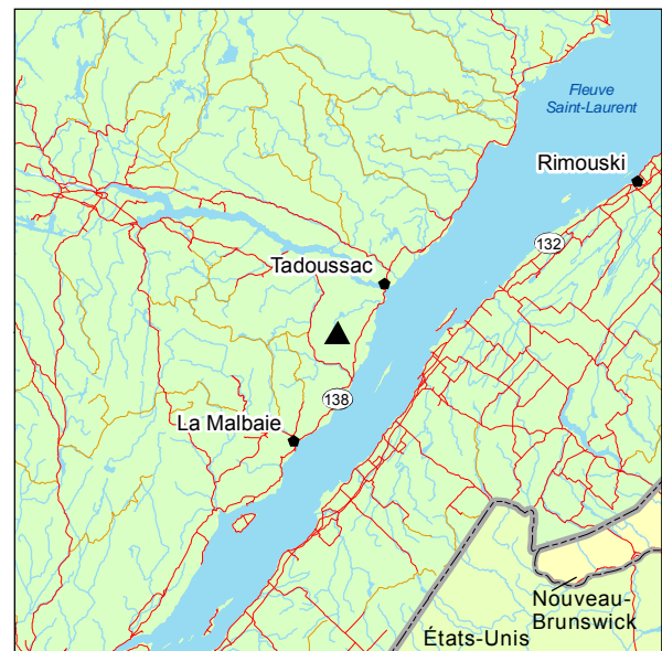
▲ Forêt rare du Lac-aux-Canards

Un cortège diversifié garnit le sous-bois. On y trouve une mousse, Polytrichum sp., un lichen, Cladina rangifera , plusieurs herbacées, dont Chimaphila umbellata , Cornus canadensis , Epigaea repens et Gaultheria procumbens , ainsi que la fougère Pteridium aquilinum .