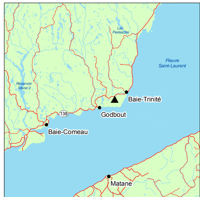
▲ Forêt rare du Lac-des-Cèdres

Dans le sous-bois, on note les herbacées Cornus canadensis , Aralia nudicaulis , Oxalis acetosella subsp. montana , Maianthemum canadense et Clintonia borealis de même que les mousses Ptilium crista-castrensis , Pleurozium schreberi et Hylocomium splendens .