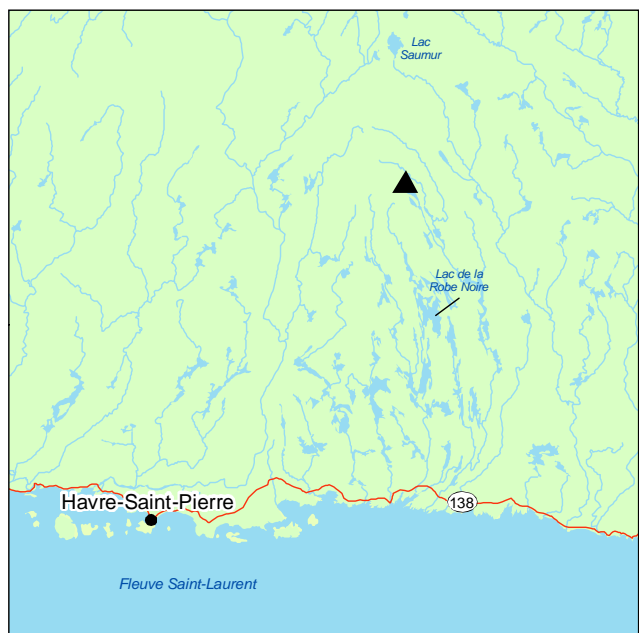
▲ Forêt ancienne du Lac-Davy

La flore de la forêt est peu diversifiée. L'amélanchier et la viorne cassinoïde viennent s'ajouter au sapin et à l'épinette noire dans la strate arbustive. Le tapis est dominé par une mousse : Pleurozium schreberi . Sur celle-ci reposent parfois Cornus canadensis et Coptis trifolia .