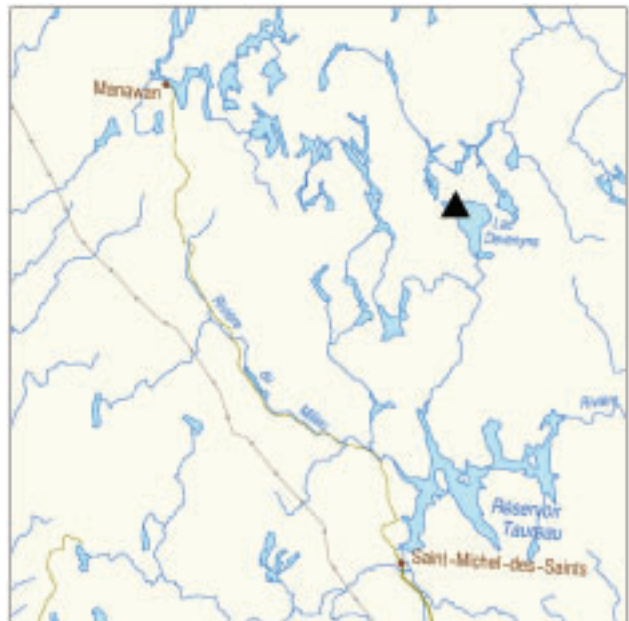
▲ Forêt rare du Lac-Devenyns

L'étage dominant du peuplement est composé presque exclusivement de pin rouge avec une présence clairsemée de pin gris; les tiges ont des diamètres de près de 40 cm à hauteur de poitrine. L'âge de ces arbres semble indiquer qu'ils ont tous trouvé leur origine à la suite d'un feu survenu autour de 1850.