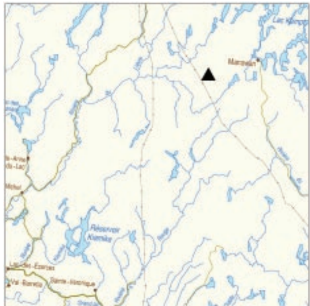
▲ Forêt rare du Lac-Doré

La forêt rare se présente en quatre peuplements composés d'épinettes noires rabougries et d'un tapis parfois abondant de lichens. Ces lichens colonisent des dépôts fluvioglaciaires de texture sablonneuse grossière et au drainage rapide. Les zones à lichens se concentrent aux endroits les plus secs. L'épinette noire est pratiquement la seule essence arborescente dans ce milieu très ouvert et où les arbres sont en bouquets. Les épinettes dominantes ont environ 85 ans, soit vraisemblablement l'âge du dernier feu. Le diamètre moyen des arbres du couvert supérieur ne dépasse guère les 12 à 14 cm à hauteur de poitrine, ce qui témoigne d'un milieu particulièrement pauvre.