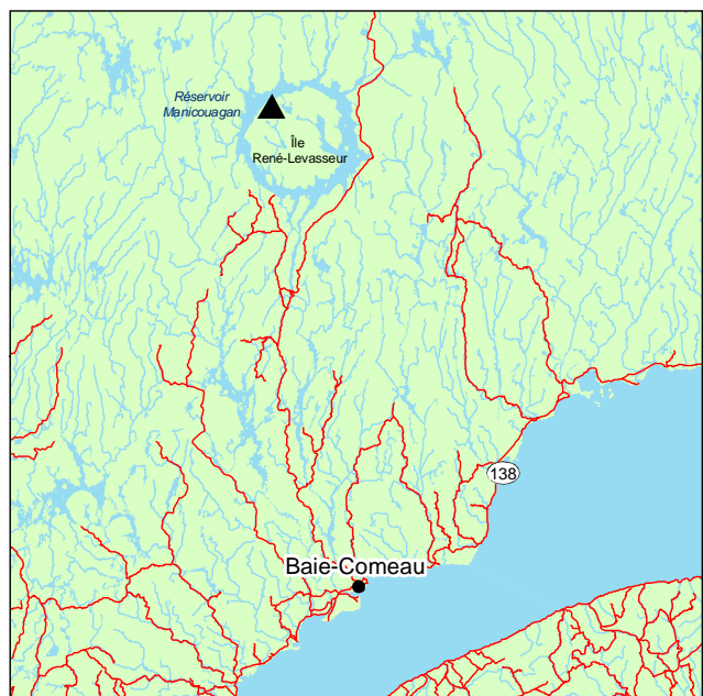
▲ Forêt ancienne du Lac-du-Grand-Héron

Toutes les essences de la strate dominante sont également présentes en sous-étage sous forme de jeunes tiges opprimées ou arbustives. À ces arbustes s'ajoutent des éricacées telles que Ledum groenlandicum et Vaccinium angustifolium . Sous ces espèces se trouve un cortège d'herbacées typiques des forêts de la zone boréale, dont