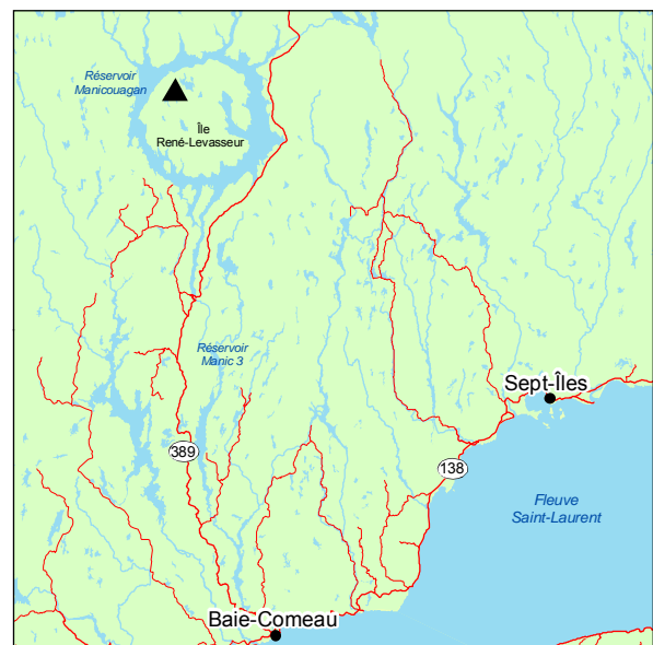
▲ Forêt ancienne du Lac-du-Grand-Poisson

La forêt ancienne du Lac-du-Grand-Poisson occupe plus particulièrement des stations où le drainage est modéré, bien que la texture du sol y soit grossière. Effectivement, le relief plutôt plat et la faible dénivellation par rapport aux lacs adjacents font en sorte que l'eau excédentaire des précipitations est évacuée lentement.