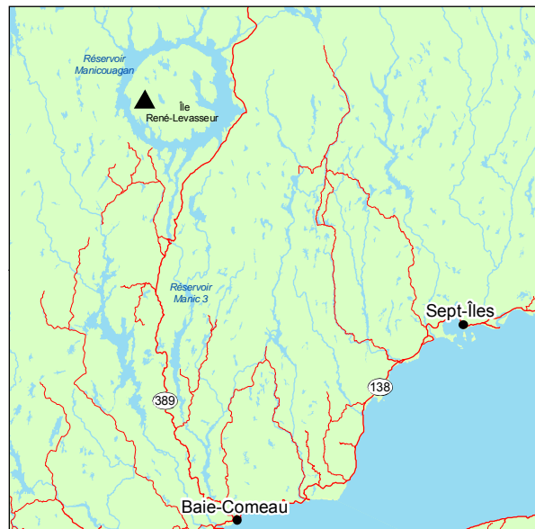
▲ Forêt ancienne du Lac-du-Piquage

La strate arbustive contient aussi Alnus rugosa , Pyrola sp. et les éricacées Kalmia angustifolia et Vaccinium angustifolium . Le tapis végétal est très largement dominé par la mousse Ptilium crista-castrensis , avec la présence de Polytrichum sp. et de Pleurozium schreberi . Notons également la présence de quelques herbacées comme Cornus canadensis et Gaultheria hispida .