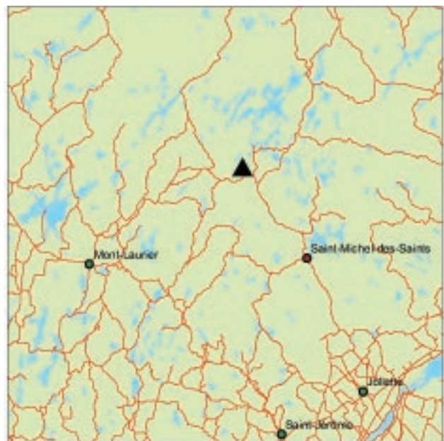
▲ Forêt ancienne de la Montagne-Kaoskiwonatinak

La forêt ancienne de la Montagne-Kaoskiwonatinak est principalement composée de bouleaux jaunes. L'érable à sucre y est cependant significativement abondant par endroits, au point de supplanter le bouleau jaune en recouvrement végétal, surtout dans les strates inférieures du couvert. Le sapin y est présent mais raréfié par l'influence de la tordeuse du bourgeon de l'épinette. L'érable à épis et le viorne à feuilles d'aulnes composent l'essentiel de la strate arbustive; ils deviennent particulièrement agressifs dans les trouées. En sous-étage, il faut noter la présence abondante de la fougère Dryopteris spinulosa .