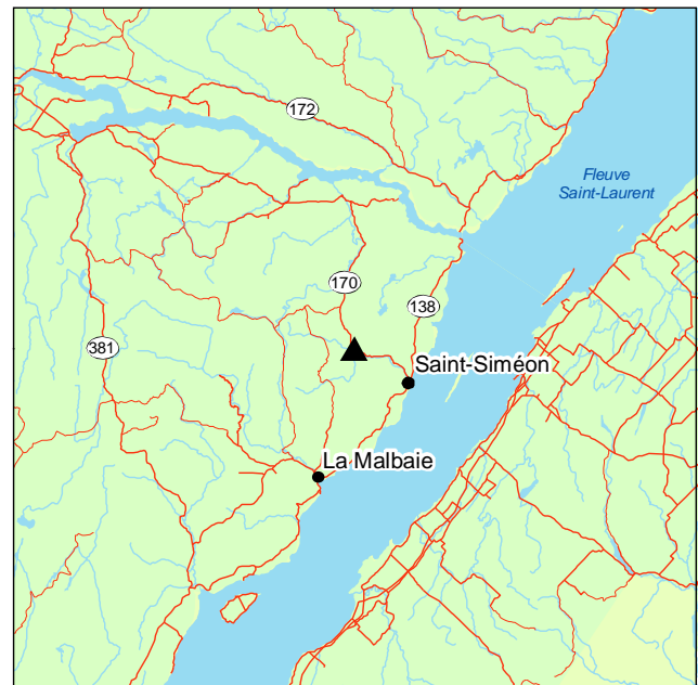
▲ Forêt rare de la Montagne-à-McLeod

La pinède rouge de la montagne à McLeod s'est installée après un feu qui date d'une centaine d'années. Cette forêt montre donc une structure équienne, c'est-à-dire que tous les arbres y ont le même âge. Elle croît sur un dépôt très mince, où abondent les affleurements rocheux, au sommet et sur les flancs abrupts de la montagne exposés au sud-ouest. Les pins ont des dimensions modestes compte tenu de leur âge : 12 m de hauteur et en moyenne 40 cm de diamètre. Le couvert est largement dominé par le pin rouge et est bien fourni. Le pin rouge y est entre autres accompagné du pin blanc, du sapin baumier et de l'épinette blanche.