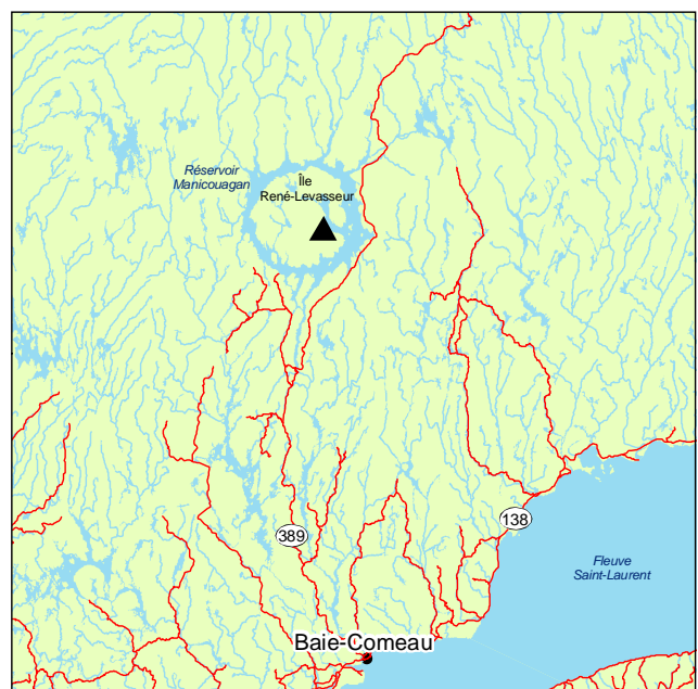
▲ Forêt ancienne de la Rivière-de-la-Clef

Au stade d'arbustes s'ajoutent Sorbus americana et Viburnum edule . Le sous-bois est dominé par les mousses Hylocomium splendens , Pleurozium