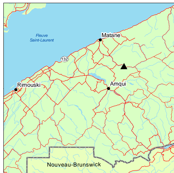
▲ Forêt rare de la Rivière-Matane

L'étage arbustif est composé, en plus des espèces présentes à l'étage supérieur, de Corylus cornuta , d' Acer rubrum , de Prunus virginiana , de Sambucus nigra ssp. canadensis , de Cornus alternifolia , de Ribes lacustre et de Viburnum opulus var. americanum . Un cortège non ligneux typique des milieux subhydriques complète le couvert. Rubus pubescens domine largement, alors que d'autres herbacées s'ajoutent, telles que Thalictrum pubescens , Geum macrophyllum , Heracleum maximum , Geum rivale et Impatiens capensis . Les fougères Osmunda cinnamomea et Onoclea sensibilis peuvent également être observées.