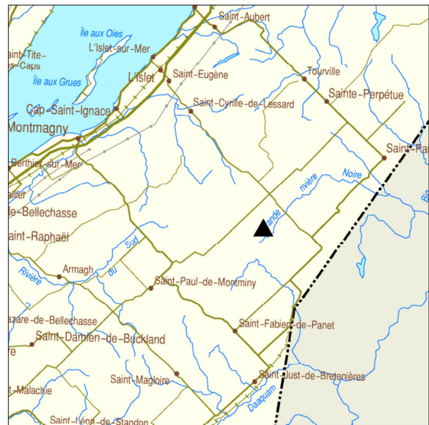
▲ Forêt ancienne de la Rivière-Rocheuse

Parmi les espèces arbustives et herbacées présentes, notons la présence marquée des Carex, de Nemopanthus mucronata et des ubiquistes latifoliées comme Maianthemum canadense et Cornus canadense . Les sphaignes recouvrent la quasi totalité du parterre.