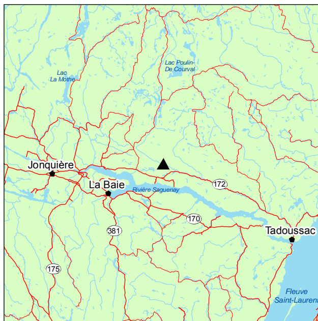
▲ Forêt rare du Ruisseau-des-Monts

La présence de l'érable à sucre est observée dans toutes les strates du peuplement, des arbres les plus grands jusqu'aux semis, ce qui lui confère un caractère pérenne. La strate arbustive est assez bien garnie et comprend Acer spicatum , Diervilla lonicera et Corylus cornuta .