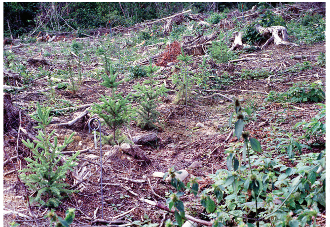
La mise en terre des plants doit respecter un espacement régulier.