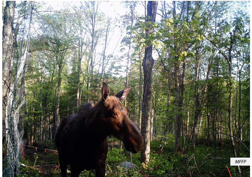
Original photographié à l'un des sites de plantation de la réserve faunique de Portneuf, à l'aide d'un piège photographique

avons ainsi déterminé que des analyses de terpènes et de groupes spécifiques de composés phénoliques, comme les flavonoïdes, seraient de bons indicateurs de la susceptibilité au broutement pour comparer les essences. De plus, des mesures de fibres (par exemple : la cellulose et la lignine) et de composés phénoliques totaux permettent de comparer la susceptibilité entre des populations d'une même essence.