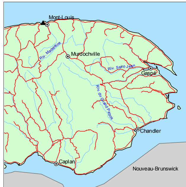
▲ Forêt refuge du Ruisseau-du-Petit-Moulin

Outre la dryoptère fougère-mâle, la forêt refuge est colonisée par une végétation herbacée comprenant des espèces d'habitat mi-ombragé comme Sanicula marilandica , Ageratina altissima , Dryopteris carthusiana et Cystopteris bulbifera .