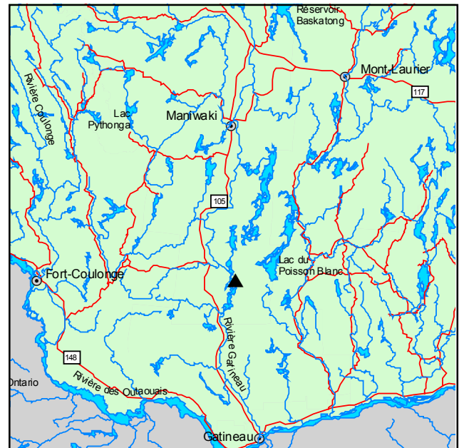
▲ Forêt refuge du Lac-Fresavy

Le thuya occidental, le sapin baumier, le pin blanc, le pin rouge et le bouleau blanc sont les principales essences dominantes dans la forêt. S'y ajoutent l'érable rouge, le frêne noir, le tilleul et le peuplier à grandes dents. Le sapin est abondant partout, alors que les pins dominent dans le haut des pentes. Le thuya devient plus important dans le bas des