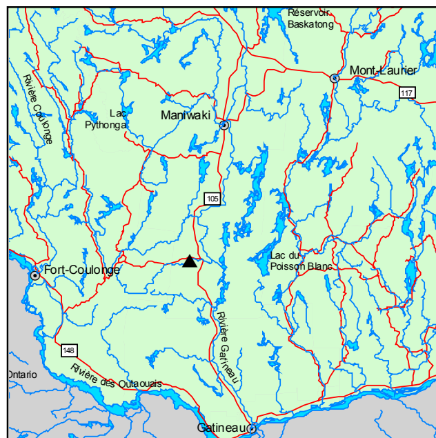
▲ Forêt refuge de la Rivière-Kazabazua

La strate arborescente de la forêt refuge renferme du peuplier faux-tremble, du chêne rouge, du pin gris, du pin rouge ainsi que du pin blanc. Dans la strate arbustive, outre le peuplier faux-tremble et le céanothe à feuilles étroites, on trouve Acer rubrum , Pinus banksiana , Populus grandidentata , Quercus rubra , Cornus rugosa , Prunus pensylvanica , Prunus virginiana , Rhus typhina , Arctostaphylos uva-ursi , Comptonia peregrina , Diervilla lonicera , Juniperus communis , Rosa blanda , Shepherdia canadensis , Symphoricarpos albus , Toxicodendron radicans et Vaccinium angustifolium . En plus de la lysimaque à quatre feuilles, de nombreuses espèces composent la strate herbacée, dont Poa pratensis , Carex umbellata , Danthonia spicata , Dichanthelium linearifolium , Oryzopsis asperifolia , Solidago juncea et Hieracium piloselloides .