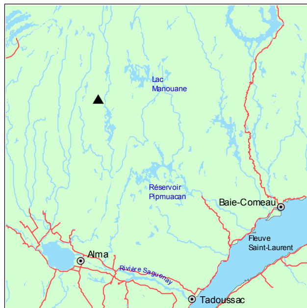
▲ Forêt ancienne du Lac-du-Boxer

La strate arborescente supérieure renferme uniquement de l'épinette noire et du sapin baumier. Ces deux mêmes essences dominent quant à la régénération en sous-étage, accompagnées des éricacées Ledum groenlandicum , Kalmia angustifolia et Vaccinium myrtilloides . La strate herbacée est occupée par Cornus canadensis , Gaultheria hispidula et Clintonia borealis . Le sol est recouvert de sphaignes et des mousses hypnacées Pleurozium schreberi et Ptilium crista-castrensis .