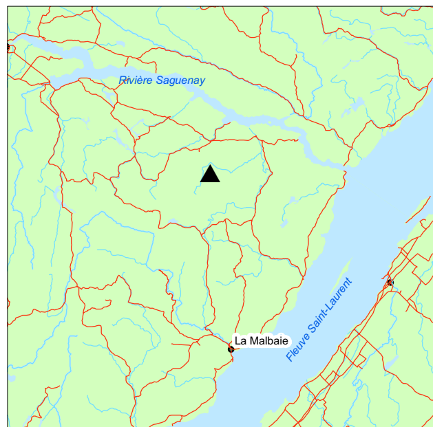
▲ Forêt ancienne du Lac-Wipi

Dans le sous-bois, on trouve plusieurs éricacées comme Vaccinium myrtilloides , Kalmia angustifolia var. angustifolia et Rhododendron groenlandicum ainsi que Ilex mucronata . Les plantes herbacées les plus fréquentes sont Clintonia borealis et Coptis trifolia . Le sol est bien couvert par Pleurozium schreberi , mais on observe aussi quelques îlots de sphaignes et d'autres de lichens.