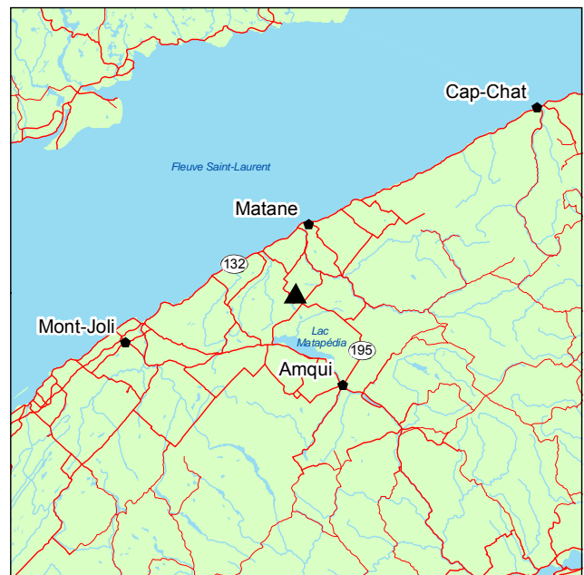
▲ Forêt ancienne de la Rivière-Petchedetz-Est

Le couvert forestier de la forêt ancienne est occupé principalement par l'érable à sucre et, dans une moindre mesure, par le bouleau jaune et le sapin baumier. Les arbres atteignent 20 m de hauteur. La strate arbustive est aussi composée de l'érable à sucre, parfois accompagné de Corylus cornuta et d' Acer spicatum . Dans la strate herbacée, on note surtout Dryopteris spinulosa var. sp. et Oxalis acetosella subsp. montana .