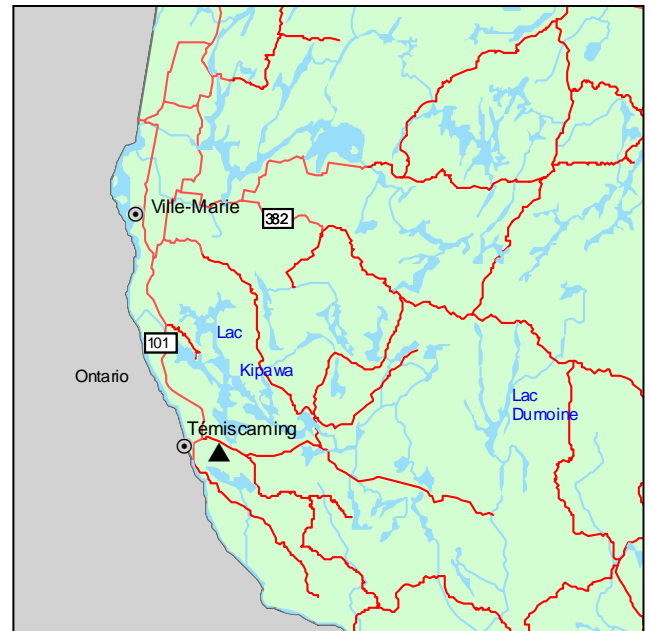
▲ Forêt ancienne du Lac-Taggart

L'étage supérieur de la forêt est dominé par le pin rouge et le pin blanc, accompagnés du thuya occidental, du sapin baumier et de l'épinette blanche. L'étage arbustif est assez diversifié et uniformément occupé par le sapin baumier, l'érable rouge, l'érable de Pennsylvanie et le bouleau jaune, auxquels s'ajoutent Corylus cornuta et Vaccinium angustifolium . Dans le parterre, la couverture herbacée n'est pas très forte, mais on note des espèces acidophiles des forêts résineuses, comme Aralia nudicaulis et Clintonia borealis , de même que des espèces préférant les parterres secs et bien ensoleillés, dont Gaultheria procumbens et Pteridium aquilinum . Quelques mousses sont présentes, notamment Bazzania trilobata .