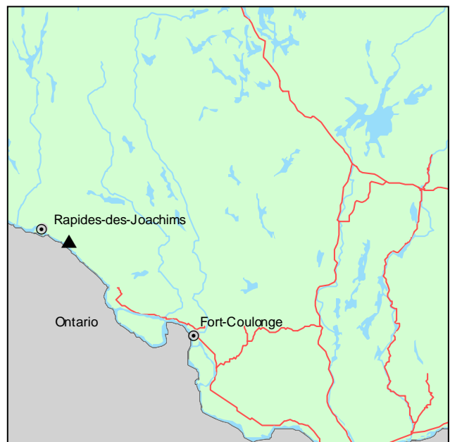
▲ Forêt refuge du Lac-à-la-Tortue

Cette forêt refuge fait partie du sous-domaine bioclimatique de l'érablière à bouleau jaune de l'Ouest. Elle se trouve à 70 km au nord-ouest de Fort-Coulonge, aux abords de la rivière des Outaouais. Elle occupe une superficie de 17 ha. Le secteur présente un relief de collines arrondies. Le roc, de nature métamorphique, affleure sur plus du tiers du territoire, particulièrement sur les sommets et les pentes.