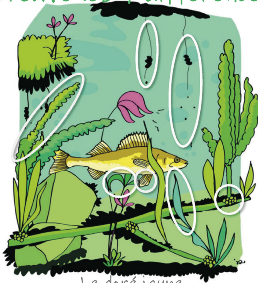
Le doré jaune