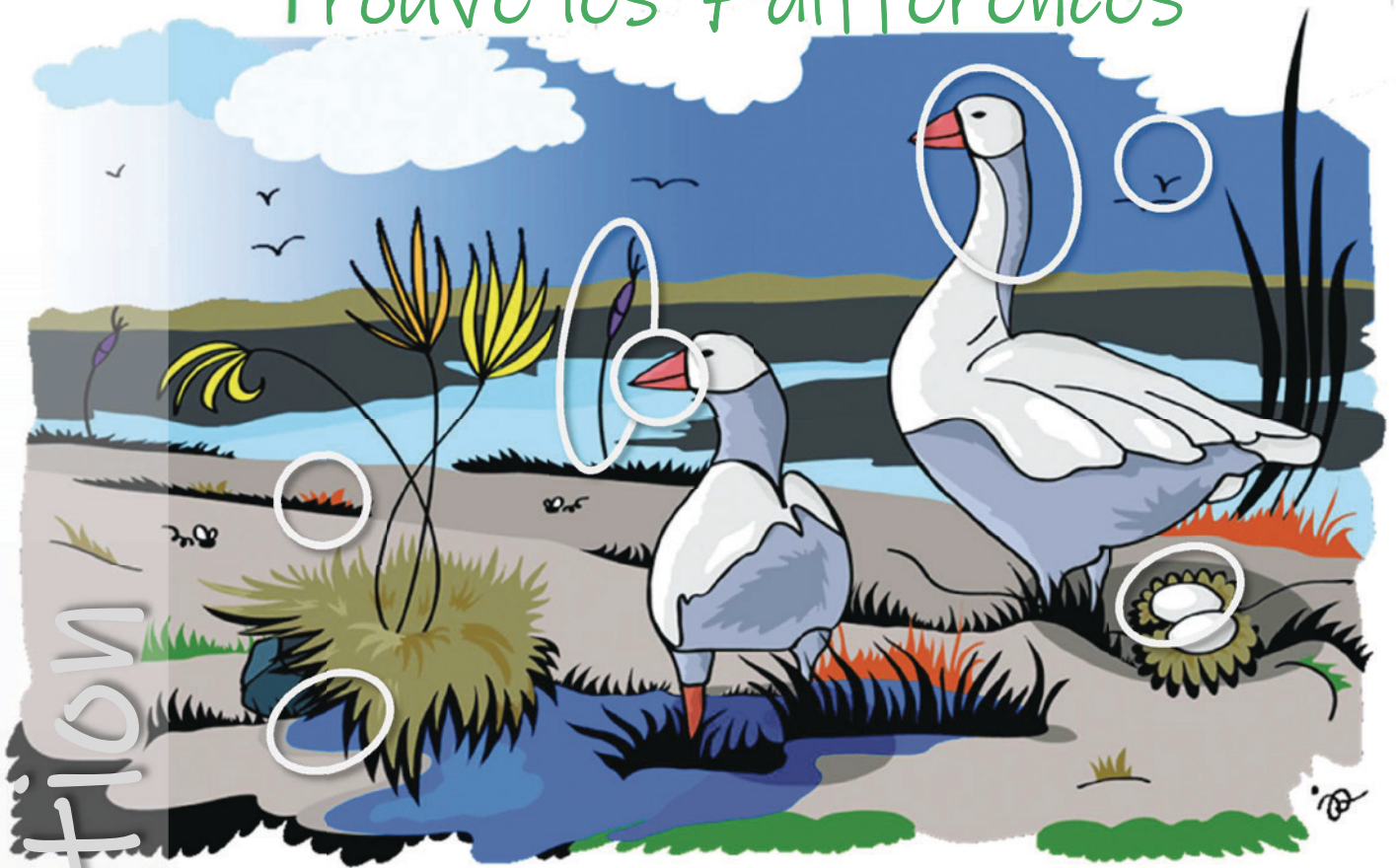
Les oies des neiges