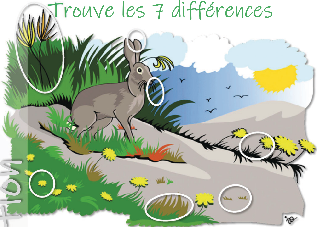
Le lièvre d'Amérique