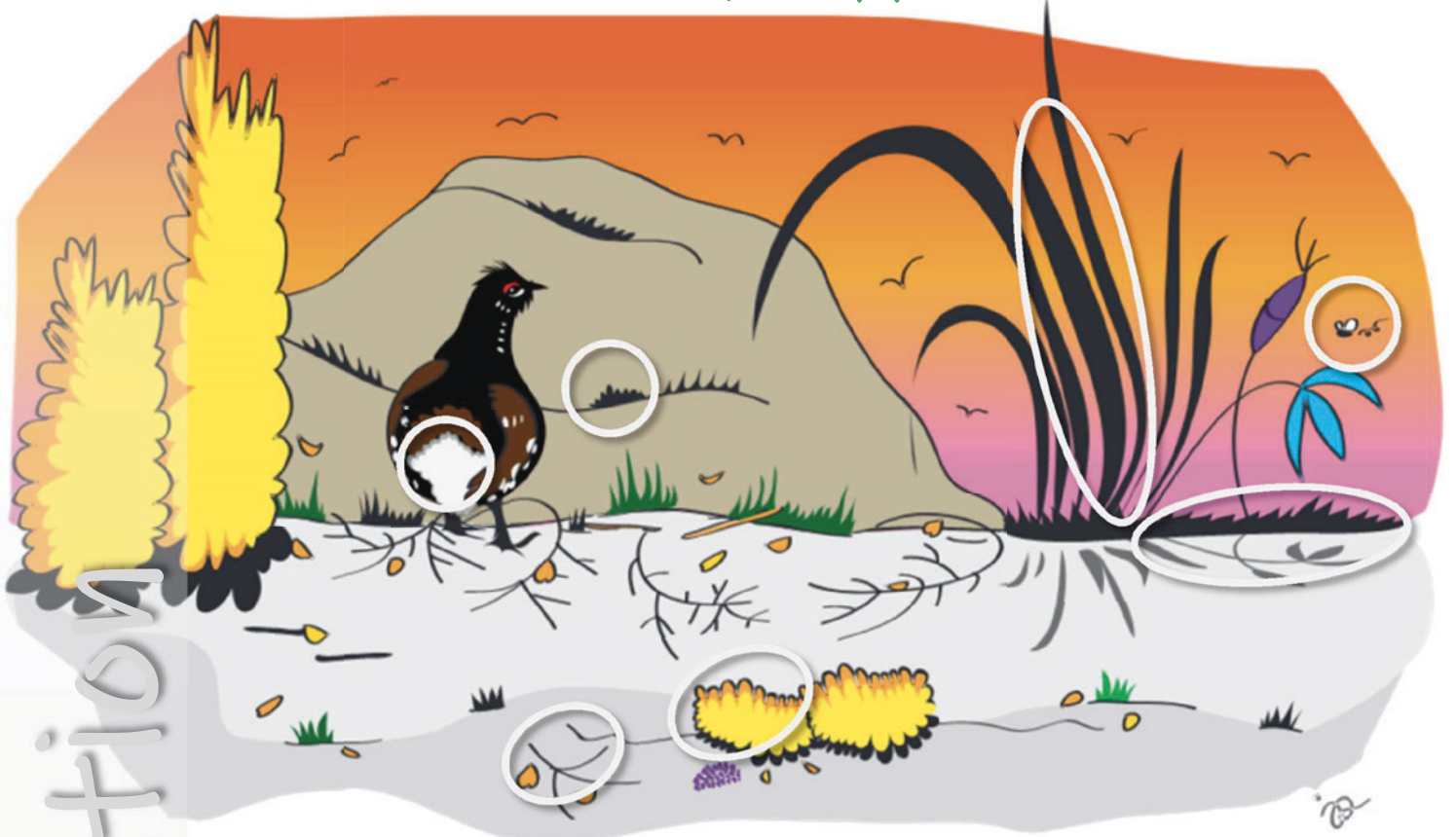
Le tétras du Canada