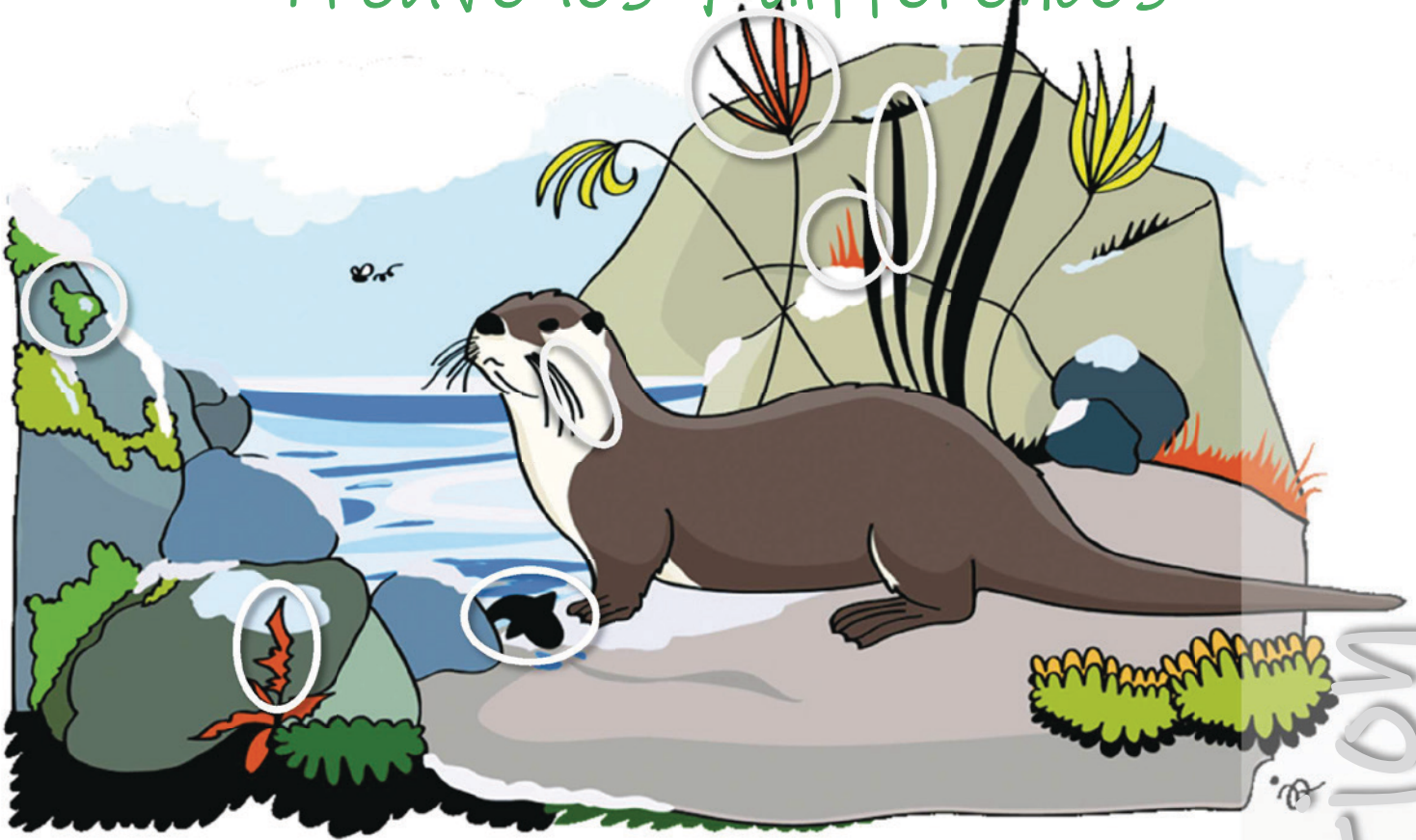
La loutre de rivière