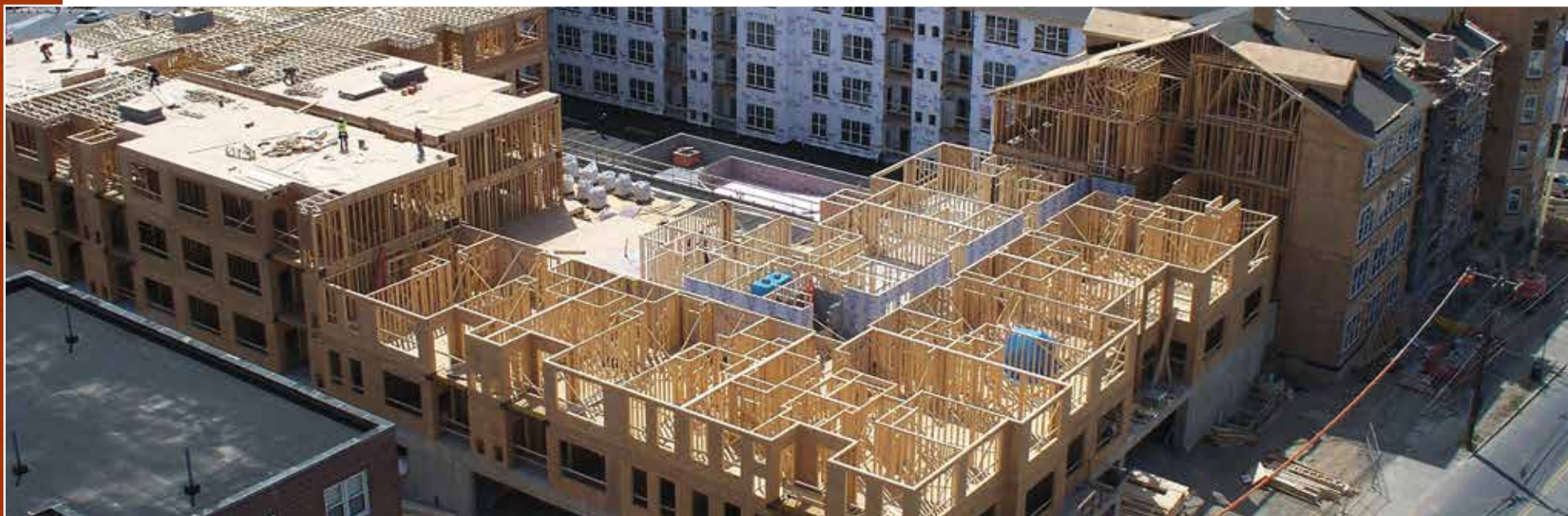
Construction multilogement à ossature légère préfabriquée.

Pierre Dufour Ministre des Forêts, de la Faune et des Parcs