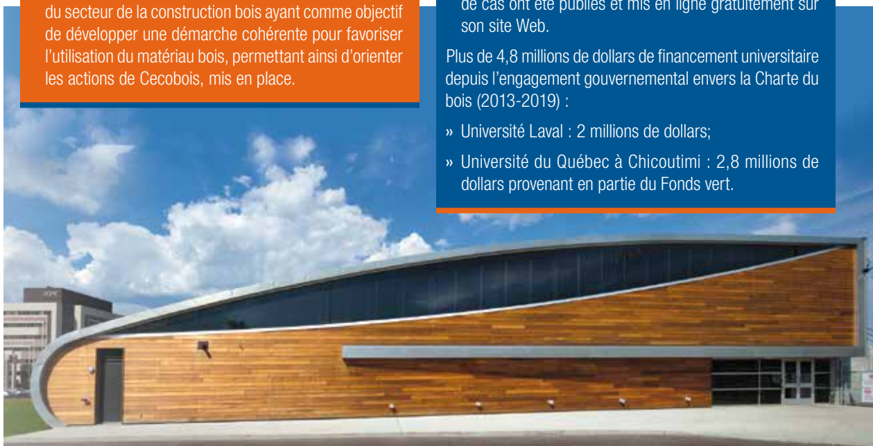
Aréna et pavillon de services de l'Université du Québec à Chicoutimi.