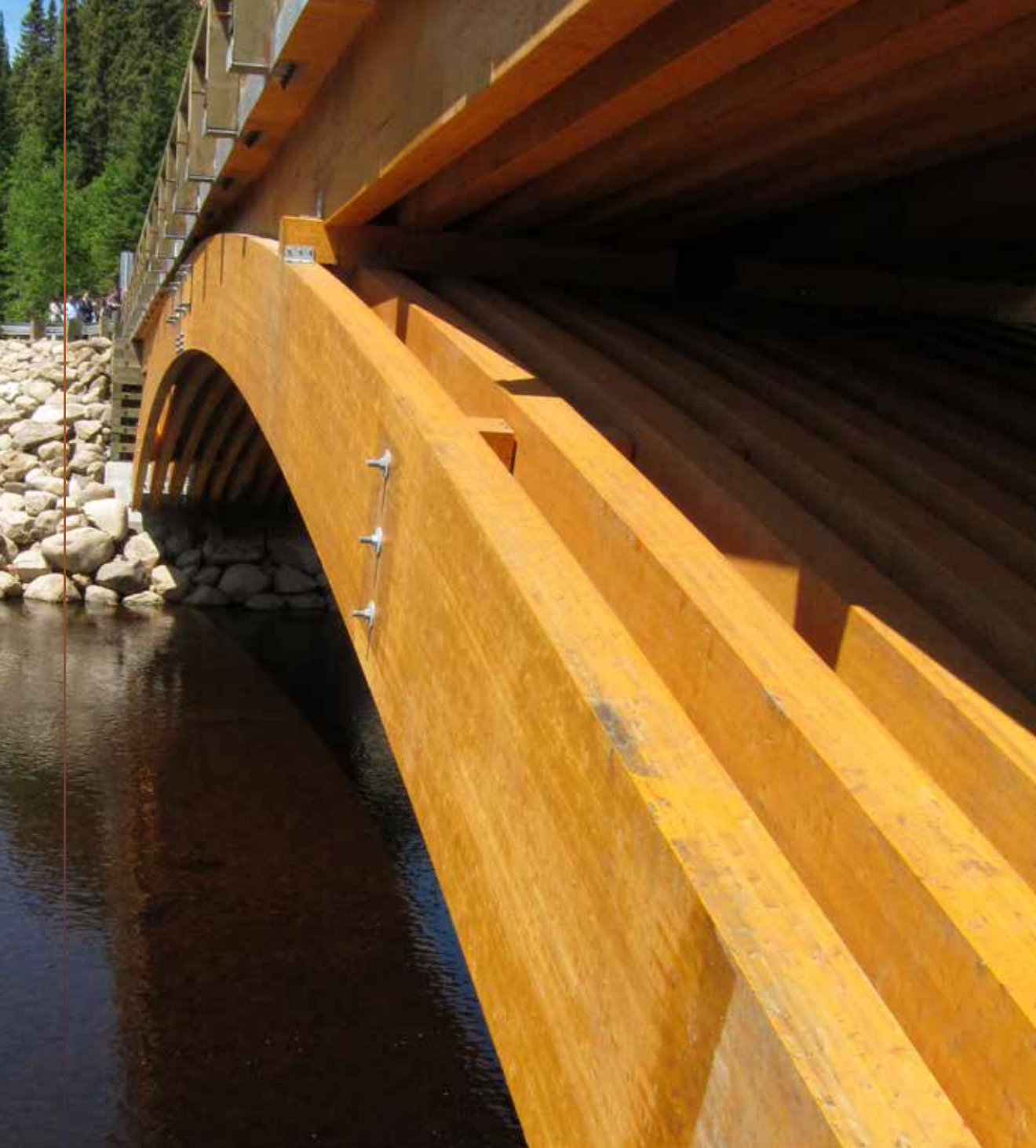
Pont de la forêt Montmorency.