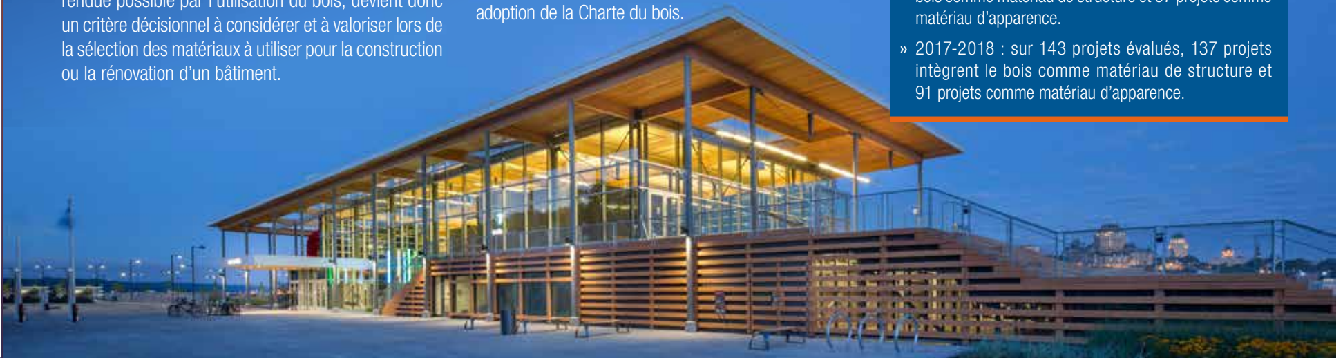
Gare fluviale de Lévis (2014-2015), un bâtiment découlant de l'exemplarité gouvernementale.