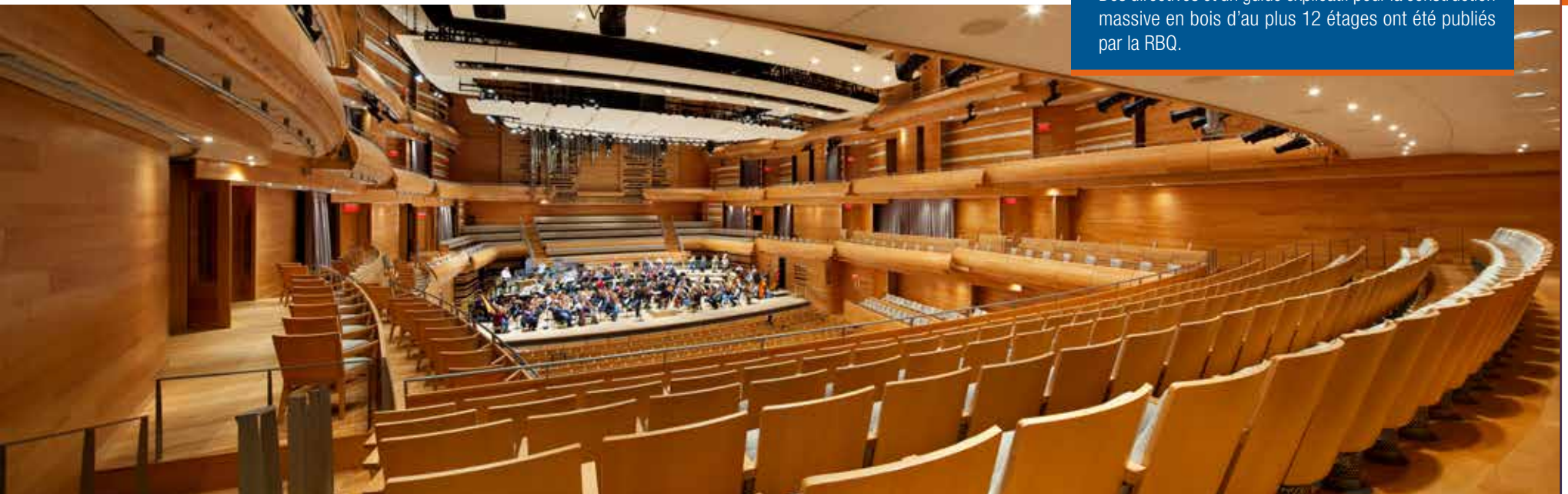
Maison symphonique de Montréal.