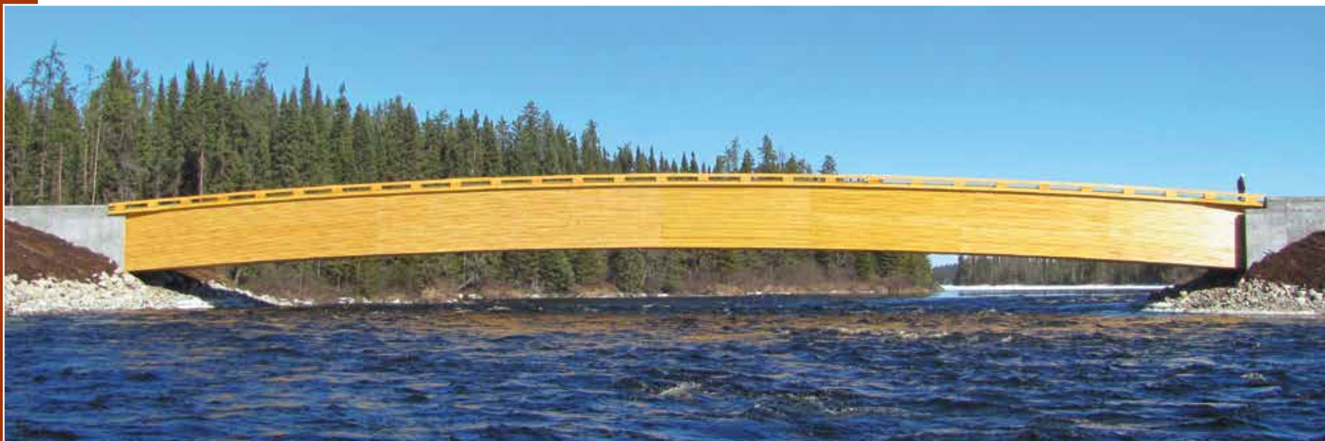
Pont Maicasagi.