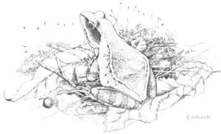
Grenouille des bois